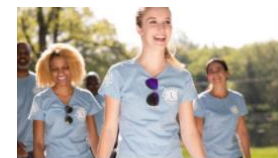
Rapport d'Activité de Club

2/ Avant votre saisie, (ajouter une activité), les questions que vous devez impérativement vous poser sont :