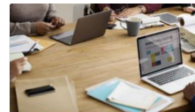
Gestion du Club

Puis Icone Gestion de club pour les présidents et Secrétaires puis RAC /// RAC directement pour les EMS et référents RAC ( voir vignettes ci contre )