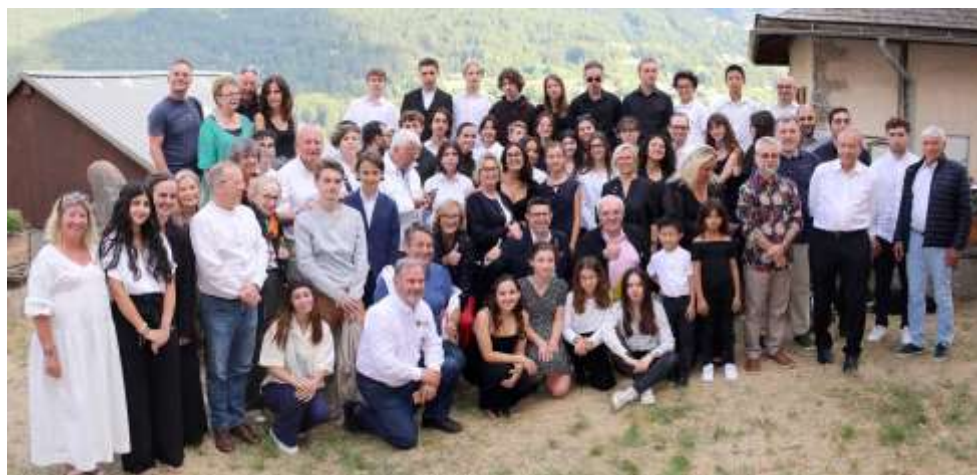
21 ème Session 2023 en la présence du Conseil des Gouverneurs 2023-2024