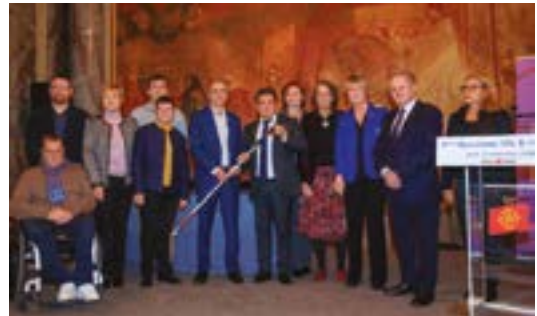
Remise de la 150 e canne

Siège Social : 12, rue de l'Etoile – 31000 TOULOUSE