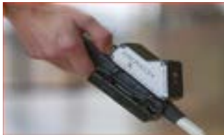
Tom Pouce III® (TP3®)